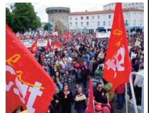
Construire le rapport de force ...

« Ne soyez pas effrayés, ayez confiance, les établissements INFRAPOLE ont toujours de l'avenir !! » Cette réaction de la direction est facilitée par l'attitude de certaines OS qui ne font pas leur devoir d'élu en ne faisant remonter aucunes doléances des cheminots. La refonte de notre statut, les attaques du RH077, la formalisation de PSA, la nouvelle donne de l'astreinte neige, toutes ces attaques ne peuvent pas rester lettres mortes.